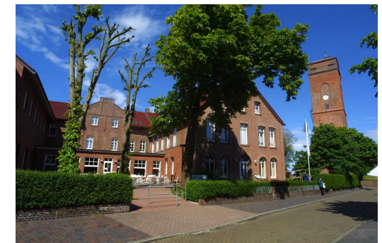
Haus Alter Leuchtturm Borkum

Für den Aufenthalt auf Borkum müssen alle Gäste Kurbeitrag zahlen. Die Gebühr begleichen die Teilnehmer*innen selber vor Ort. Der Betrag ist nicht im Seminarpreis enthalten. Die aktuellen Gebühren finden Sie auf www.borkum.de